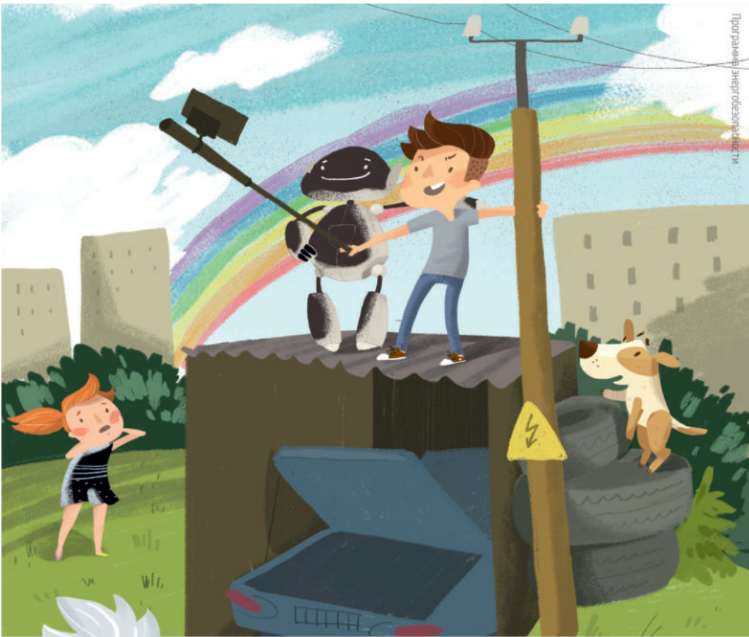
Иллюстрация: Евгений Мещеряков